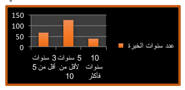
شكل رقم(2) يوضح عدد سنوات الخبرة بالنسبة لعينة الدراسة

باستقراء بيانات الجدول السابق رقم (7) والخاص بتحديد سنوات الخبرة جاءت يتضح لنا أن جاء في الترتيب الأول الخبرة من 5 سنوات لأقل من 10سنوات بإجمالي (127) مفردة، وبنسبة بلغت (45.9%)، بينما جاء في الترتيب الثاني 10 سنوات فأكثر بإجمالي(83) مفردة، وبنسبة بلغت (45.9%)، وجاء في الترتيب الثالث والأخير 3 سنوات لأقل من 5 سنوات بإجمالي (67) مفردة ونسبة بلغت (24.1%). ونستنج مما سبق أن العدد الأكبر للسادة أعضاء هيئة التدريس يقع بين مدرس واستاذ وتعتبر هذه الفترة هي الفترة التي يتم التحضير فيها للحصول على درجة استاذ مساعد، مما يعزي إلى وقوع سنوات الخبرة ما بين 5 سنوات لأقل من 10 سنوات في الترتيب الأول.